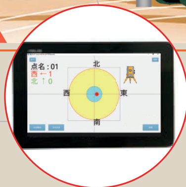
杭打機操作者の画面